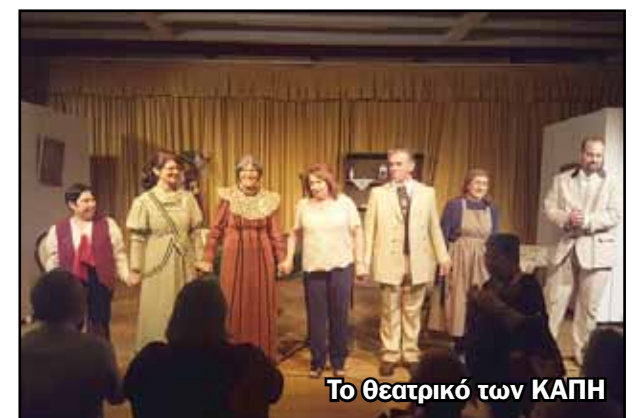
Το θεατρικό των ΚΑΠΗ