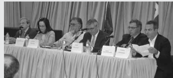
Το πάνελ των ομιλητών

Τη δημιουργία καινούργιου κόμματος που θα τοποθετηθεί στο κέντρο της πολιτικής σκηνής ανακοίνωσε μέρες άκρες η Άννα Διαμαντοπούλου από το πάνελ της συζήτησης που διοργανώθηκε το απόγευμα της Δευτέρας 16 Μαΐου, στη γεμάτη αίθουσα του Πολιτιστικού Κέντρου στην Κηφισιά.