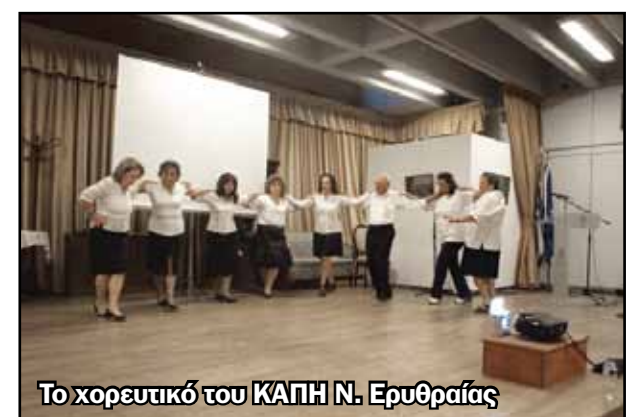
Το χορευτικό του ΚΑΠΗ Ν. Ερυθραίας