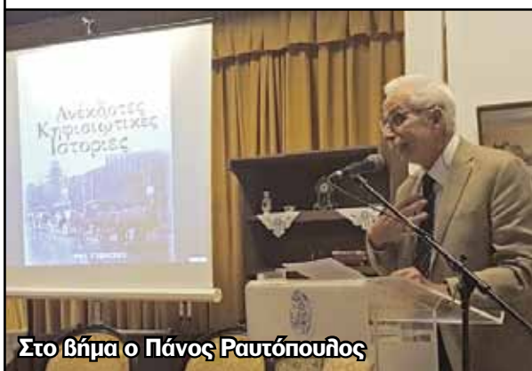
Στο βήμα ο Πάνος Ραυτόπουλος