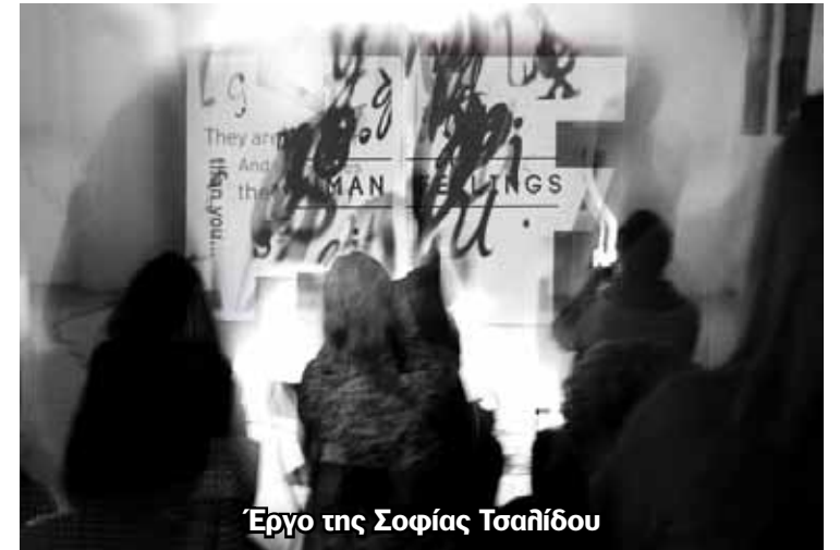
Έργο της Σοφίας Τσαλίδου

Η τέχνη της φωτογραφίας και του βίντεο έπαιξαν καθοριστικό ρόλο στον 20 αιώνα, έχοντας καταλυτική επίδραση στη διαμόρφωση αυτού που αποκαλείται σύγχρονος οπτικός πολιτισμός. Σήμερα περισσότερο από ποτέ αντί να διαχωρίζουμε αυτές τις καλλιτεχνικές εκφράσεις πρέπει να τις συνδέουμε διότι έχουν κοινή γλώσσα, τη γλώσσα της οπτικής εικόνας.