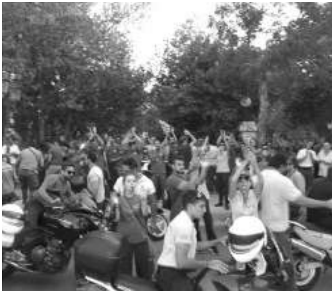
Από την κινητοποίηση των Δημοτικών Αστυνομικών κατά τη θεμελίωση του πάρκινγκ

Ο αντιδήμαρχος ανέφερε ότι έχουν ήδη τυπωθεί πάνω από 120 χιλιάδες κάρτες στάθμευσης. Η τιμή είναι 1 ευρώ η ώρα, ενώ ανακοινώνονται σημεία πώλησης. Η πώληση των καρτών αυτών αναμένεται να επιφέρει και ένα σημαντικό έσοδο για το Δήμο. Κάθε μέτρο βέβαια εξαρτάται αν θα είναι καλό ή κακό και από τον τρόπο που θα εφαρμοστεί. Όσον αφορά την έναρξη ενεργοποίησής του, αναφέρθηκε ότι στην αρχή θα λειτουργήσει σχετικά χαλαρά με τους περισσότερους ελέγχους να αφορούν το παράνομο παρκάρισμα, ειδικά σε ράμπες. Σιγά σιγά και μέχρι να ξεκαθαριστούν και οι κάρτες μόνιμων κατοίκων και να προσαρμοστεί ο κόσμος