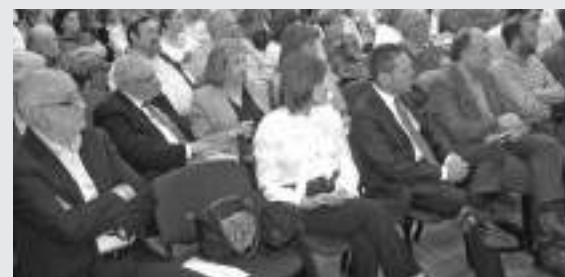
Ο Γιάννης Στουρνάρας στη πρώτη σειρά και δίπλα του οι διοργανωτές Αγγελική Συνοδινού και Γιώργος Ζαραφωνίτης

Η κα Διαμαντοπούλου μίλησε για την απαξίωση των πολιτικών αλλά και για τις αξίες γενικότερα χωρίς όμως να βάζει και τον εαυτό της σε αυτούς που βοήθησαν να συμβεί κάτι τέτοιο. Αναφέρθηκε επίσης σε στατιστικά στοιχεία για τους μισθωτούς του Δημοσίου λέγοντας ότι παρόλες τις αλλαγές και τα μνημόνια το 60% σήμερα των αμειβομένων υπαλλήλων είναι δημόσιοι υπάλληλοι και τέλος προανήγγειλε την ίδρυση κόμματος που θα κινηθεί στο χώρο του Κέντρου, κοιτώντας με νόημα προς τη μεριά του προέδρου της Τράπεζας της Ελλάδας και συντοπίτη μας Γιάννη Στουρνάρα, ο οποίος προσήλθε στην εκδήλωση λίγο καθυστερημένος αλλά παρόλα αυτά τράβηξε αμέσως τα βλέμματα πάνω του.