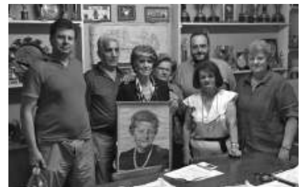
Το νέο Δ.Σ. του ΖΑΟΝ

Με αθρόα συμμετοχή των μελών πραγματοποιήθηκαν την Κυριακή 22 Μαΐου οι εκλογές για την ανάδειξη νέου προεδρείου του θρυλικού ΖΑΟΝ.