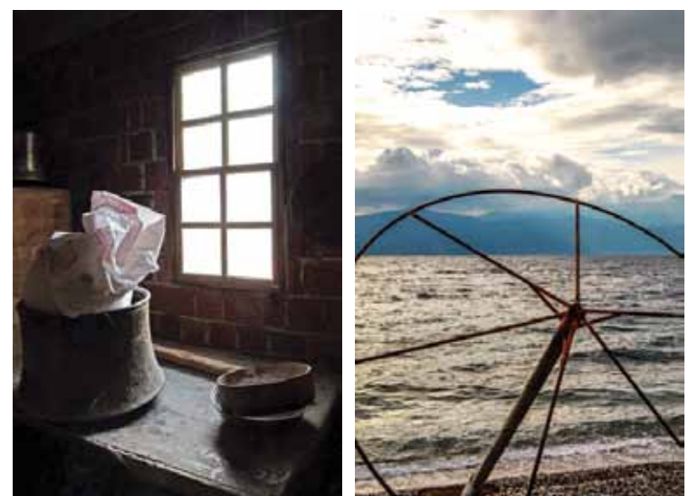
Έργα της Κατερίνας Κορωναίου και της Μαρίας Σπά

Ο Καλλιτεχνικός Διευθυντής του Φεστιβάλ: Δρ. Γρηγόρης Βλασσάς, Καθηγητής ΤΕΙ Αθήνας