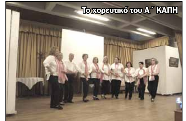
Το χορευτικό του Α' ΚΑΠΗ