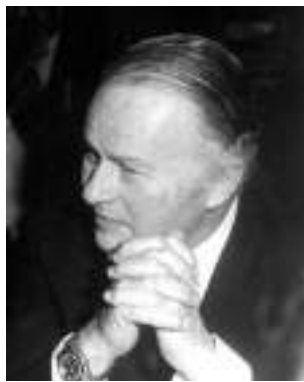
► Του ΓΙΑΝΝΗ ΜΕΛΑ

άλλα πάλι ταλαίπωρα πεζοδρόμια φιλοξενούνται ελαιόδεντρα και σε άλλα πάλι πεζοδρόμια "βλασταίνουν" χαριτωμένα ταιμεντένια κολονάκια που τα φυτεύουν ασυνείδητοι και τα οποία εμποδίζουν με τους οδηγούς να παρκάρουν επί των πεζοδρομίων αλλά δυστυχώς γίνονται αιτία οι πεζοί να τραυματίζονται και οι νομοταγείς οδηγοί να καταστρέφουν τις πόρτες των αυτοκινήτων τους όταν τολμήσουν να τις ανοίξουν για να βγουν! Δηλαδή γενικώς επικρατεί μια κατάσταση που εάν δεν γνωρίζαμε ότι πράγματι δυστυχώς συνεχίζει να υφίσταται, θα μπορούσε ο αναγνώστης τα γραφόμενά μου να τα θεωρήσει σαν υπερβολές συγκρινόμενες με όσα θα μπορούσε να διαβάσει μέσα σε κάποιο βιβλίο του πλούσιου σε ανακρίβειες τερατολόγου βαρόνου Μυνχάζουεν, μόνο που αυτός έγραφε τα δικά του απίστευτα.... τον 18ο αιώνα!