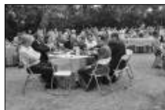
Μεγάλος αριθμός επιχειρηματιών παραβρέθηκε στην εκδήλωση