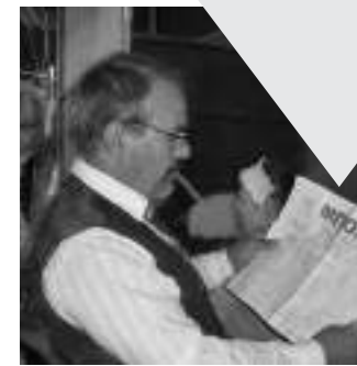
«Μπόχα» η εφημερίδα στην παράσταση «του Κουτρούλη ο γάμος», μια εφημερίδα που ειδικεύταν στα

◆ Τα καμμένα τα ζωντανά βρίσκουν χώμα στα πάρκα και κάνουν εκεί ότι τα έβγαλαν οι ιδιοκτήτες τους να κάνουν έξω από τα διαμερίσματα. Έρχονται μετά τα παιδάκια τα βλέπουν όλα καφέ και δεν ξεχωρίζουν τα χώματα από ό,τι άφησαν οι σκύλοι και δε μερίμνησαν να απομακρύνουν οι ιδιοκτήτες τους. Οι πινακίδες που καμιά φορά υπάρχουν «απαγορεύονται οι σκύλοι» δεν είναι εύκολο να διαβαστούν από τα ίδια τα τετράποδα, ενώ μάλλον αγνοούν το νόημα των λέξεων αυτών και δίποδοι συνοδοί σκύλων. Κάποιοι από τους γείτονες τέτοιων πάρκων ζητούν κάποιος να μεριμνήσει ώστε τα πάρκα να μη χρησιμεύουν ως αφοδευτήρια κατοικίδιων.