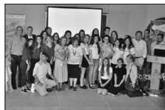
Αναμνηστική φωτο με τους μαθητές που συμμετείχαν στο πρόγραμμα «Εικονική Επιχείρηση»