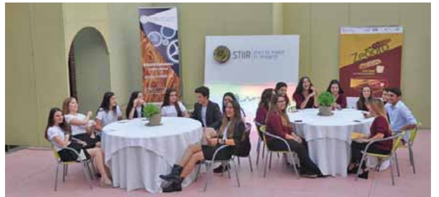
Μαθητές της Κηφισιάς στην εκδήλωση του Δήμου για τη νεανική επιχειρηματικότητα

ΟΙ ΠΡΟΣΠΑΘΕΙΕΣ ΤΟΥ ΔΗΜΟΥ ΓΙΑ ΤΗΝ ΑΝΑΠΤΥΞΗ ΤΗΣ ΕΠΙΧΕΙΡΗΜΑΤΙΚΟΤΗΤΑΣ