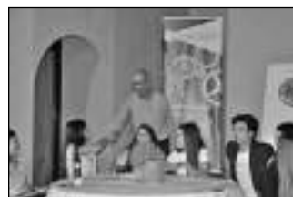
Ο Δήμαρχος συγχαίρει τους Κηφισιώτες μαθητές

Ενδιαφέρουσες επιχειρηματικές προτάσεις έκαναν οι μαθητές του 3ου Γενικού Λυκείου Κηφισιάς και του Β' Αρσακείου Τοσίτσειου Λυκείου Εκάλης , συμμετέχοντας στο εκπαιδευτικό πρόγραμμα «Εικονική Επιχείρηση» του «Σωματίου Επιχειρηματικότητας Νέων/Junior Achievement Greece» και ο Δήμος Κηφισιάς τους τίμησε σε ειδική εκδήλωση τη Δευτέρα 27 Ιουνίου. Στο χαιρετισμό του ο δήμαρχος, Γιώργος Θωμάκος , αναφέρθηκε στις καινοτομίες που έχει εισάγει ο Δήμος, μία εκ των οποίων είναι η τοπική Επιχειρηματικότητα. Με συνεργασίες με την ΕΣΣΕ , τον ΕΒΕΑ και άλλους φορείς προσπαθεί ο Δήμος να δημιουργήσει τα επόμενα χρόνια μια όαση επιχειρηματικότητας και να την συνδέσει με την έρευνα, στοχεύοντας μελλοντικά σε γενικότερη ανάπτυξη που θα κρατήσει τη νεολαία στη χώρα μας. Την παρουσίαση της εκδήλωσης έκανε ο δημοσιογράφος Νίκος Υποφάντης και οι ομάδες εργασίας από τα δύο σχολεία παρουσίασαν τα αποτελέσματα των προσπαθειών τους.