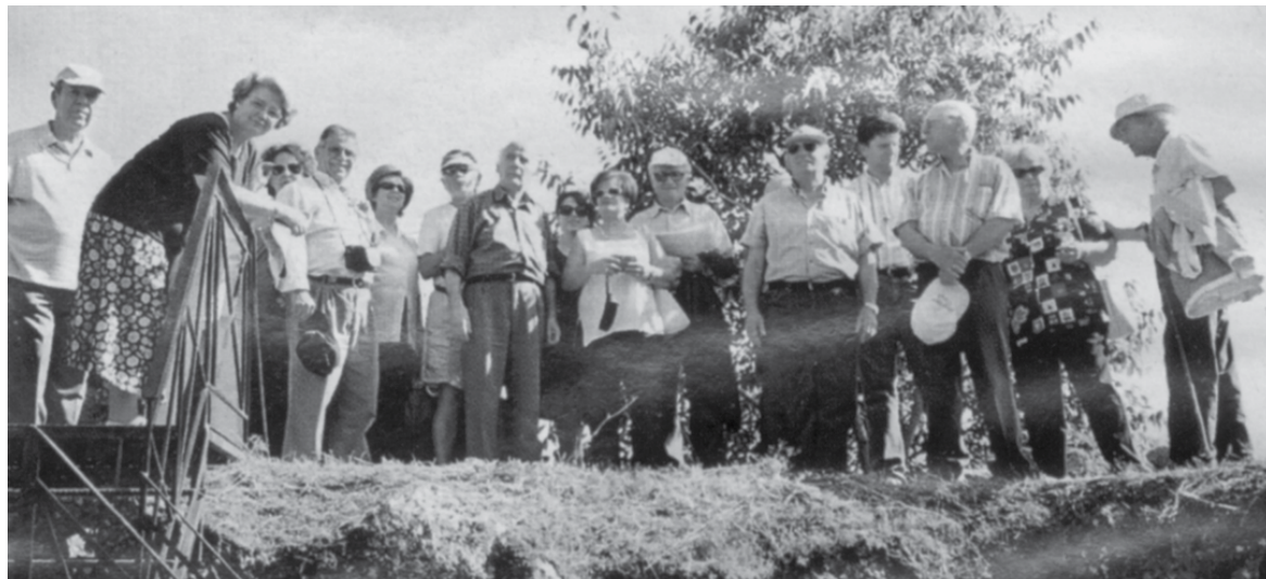
Από εκδρομή του Συλλόγου στον Αχέροντα