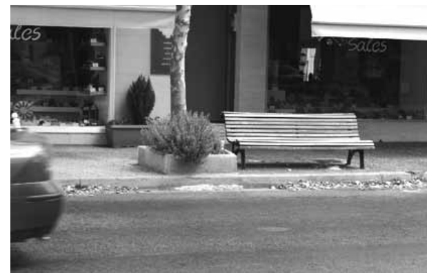
Με θέα στη Λεωφόρο Κηφισιάς

Η απάντησή μου έχει σχέση με το πρώτο ερώτημα που μου έκανες αλλά και με τη διαφωνία που σου ανέφερα. Για το λόγο που κάθομαι εδώ σήμερα. Κοιτάζω τα κολωνάκια που ξαφνικά έφυγαν. Αύγουστο μήνα εδώ στην Κασσαβέτη και ακόμη δεν γύρισαν στη θέση τους, όπως εδώ πίσω μας. Εάν λείπουν για κάποιο έργο, έπρεπε να βάλουν μια ταμπέλα «Συγγνώμη, λόγω έργων». Αλλά, αφού δεν βάλανε τίποτα, μπορεί να ετοιμάζεται μια μόνιμη κατάσταση. Όπως συμβαίνει πιο πάνω, στην οδό Κολοκοτρώνη. Σε μερικά σημεία δικαιολογημένα λείπουν τα κολωνάκια λόγω των κατοικιών που διαθέτουν πάρκινγκ. Αλλά σε άλλα σημεία, αδικαιολόγητα έφυγαν χωρίς επιστροφή και εκεί τώρα παρκάρουν, με όλες τις συνέπειες. Εκεί που λείπουν δικαιολογημένα θα έβαζα και μια αλυσίδα. Για να αποφύγουμε μια εικόνα εγκατάλειψης, παρακμής. Το συνηθισμένο λεγόμενο «περίπου». Αλλά, εδώ; Φοβάμαι ότι ξεκινάμε από εδώ και πάμε πιο πέρα και βλέπουμε. Το περασμένο Σάββατο το πρωί είχαν παρκάρει ένα 4Χ4