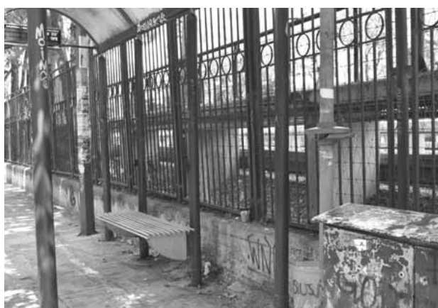
Παγκάκι στάσης λεωφορείου κάτω από τον ΗΣΑΠ