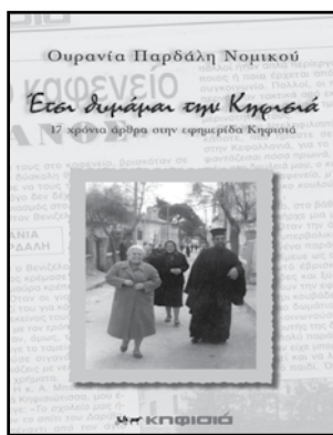
Το βιβλίο της Ουρανίας Παρδάλη - Νομικού κυκλοφορεί από τις Εκδόσεις Κηφισιά