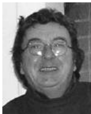
► Γράφει ο ΦΡΑΝΤΖΕΣΚΟ ΒΙΑΝΕΛΛΟ

Ξανακοιτάζω τις φωτογραφίες, φετινές και περσινές. Του χρόνου θα προστεθούν και άλλες. Τις περιμένουμε.