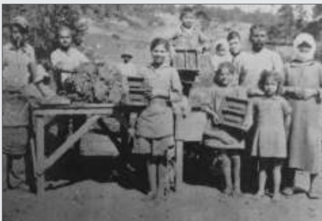
Σπατατζίκι 1925. Ερυθραιώτες πρόσφυγες κατασκευάζουν τούβλα

(Πηγές: Αχ. Κοντοστάθη «Η Ερυθραία στη χαραυγή της ζωής της», Αφηγήσεις παλιών Ερυθραιωτών και Ένωση Μικρασιατών Ν. Ερυθραίας).