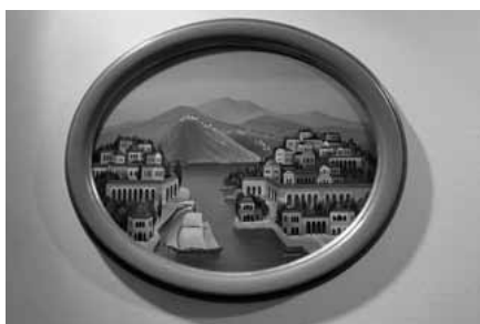
Έργο του Θανάση Μπακογιώργου

Ο όρος «ναϊφ», προερχόμενος από τη γαλλική λέξη naive (αφελής), χαρα-