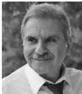
► Γράφει ο ΓΙΩΡΓΟΣ ΔΗΜΑΚΗΣ*

«Ναι, εδώ και πολλά χρόνια, από τότε που είμαι σε αυτό το σπίτι.