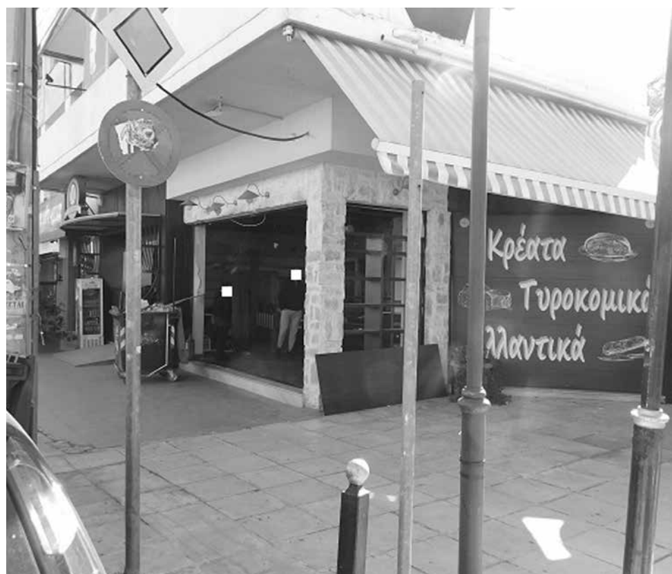
Στόχος εμπρηστικής επίθεσης έγινε τα ξημερώματα της Τρίτης 14 Μαρτίου γνωστό παντοπωλείο της Νέας Ερυθραίας