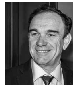
■ Του ΝΙΚΟΥ ΧΙΩΤΑΚΗ

Από τον επόμενο χρόνο, σε κάθε Τοπικό - δημοτικό Σχέδιο Διαχείρισης Αποβλήτων πρέπει να δίνονται στους δημότες οικονομικά κίνητρα για να ανακυκλώνουν, να εφαρμοστεί σταδιακά το σύστημα «πληρώνω όσο πετάω» που καθιστά τον πολίτη πρωταγωνιστή στην υιοθέτηση ενός νέου μοντέλου ζωής, ενώ παράλληλα του δίνει τη δύναμη να «ελέγχει» και να αξιολογεί καθημερινά τον τρόπο με τον οποίο ο κάθε Δήμος διαχειρίζεται σε τοπικό επίπεδο τα απορρίμματα που παράγει, με άμεση επίπτωση «στην τσέπη του».